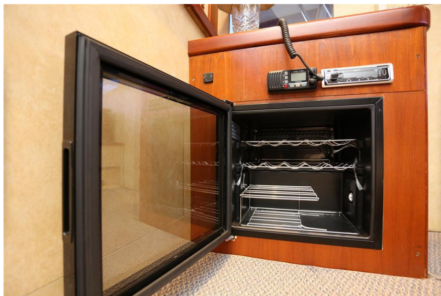
Un dettaglio della cantinola.

Sottocoperta, troviamo da poppa a prua: la cabina armatoriale con matrimoniale disposto per baglio sulla dritta; una cabina con due letti a castello sul lato opposto; un amplissimo locale toilette con accesso interno alla cabina armatoriale; una cabina marinaio od eventuale ospite a proravia. Un secondo locale toilette con doccia è posizionato per servire le due cabine con letti singoli.